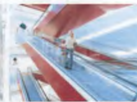
Eskalátory & pohyblivé chodníky