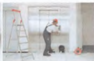
Servis 24 hodín